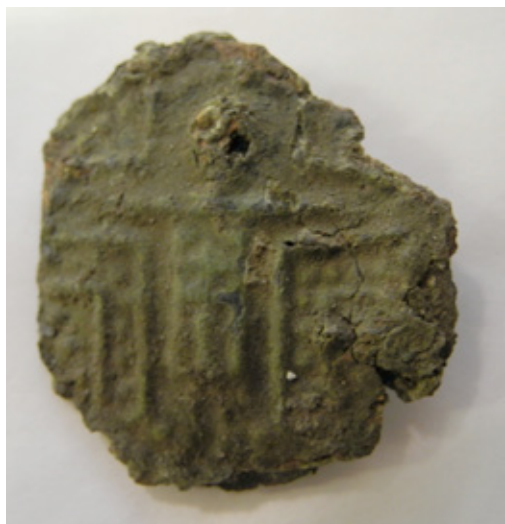
Fibel, fundet i Vester Vandet 2013-10-09

Der vil blive fortalt om udgravningen og dens resultater, og de vil blive sat ind i den større sammenhæng bl.a. i forhold til kristendommens indførelse og kirkebyggeriet i middelalderen.”