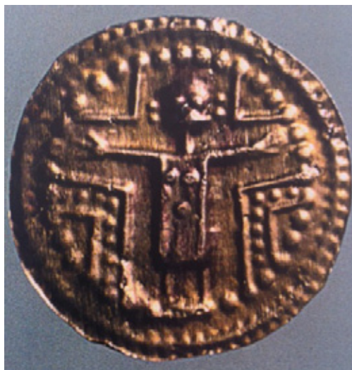
Karolingisk blikfibel, fundet i Hedeby, 800-tallet