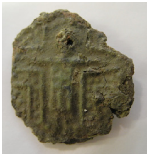
Fibel, fundet i Vester Vandet 2013-10-09

Der vil blive fortalt om udgravningen og dens resultater, og de vil blive sat ind i den større sammenhæng bl.a. i forhold til kristendommens indførelse og kirkebyggeriet i middelalderen.”